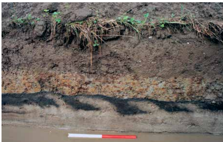
Fig. 3. Pløjemarken ved Klinkerne. Tværprofil af ager med meget tydelige vendte furer, som er dækket af lyst brungråt klæg under det moderne muldlag. De skråstillede lagdelte furestrimler skyldes uden tvivl, at ploven er pløjet gennem det oprindelige muldlag og ned i det lysere undergrundssand og har vendt den afskårne furestrimmel med muld og sand (mod venstre på billedet) delvist henover den forrige vendte furestrimmel. Bemærk den karakteristiske bølgeformede furebund, som grundlæggende skyldes plovens lodrette langjern, vandrette skær og den skråstillede muldfjæls skraber mod furebunden.

The field at Klinkerne. Cross-section of the field showing very distinctive turned furrows, which are covered by light-brown, greyish marsh soil beneath the modern plough soil. The inclined, layered furrow strips are undoubtedly the result of the plough having cut through the original top soil and into the lighter subsoil, turning the cut-off furrow strip with topsoil and sand (to the left in the picture) partially across the previously turned furrow strip. Note the characteristic wave-shaped furrow base is due to the vertical coulter, the horizontal share and the inclined mouldboard, which scraped the bottom of the furrow.