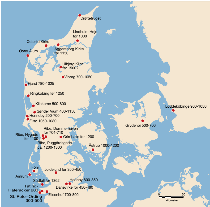
Fig 7. Fund af plovspor i det danske område.