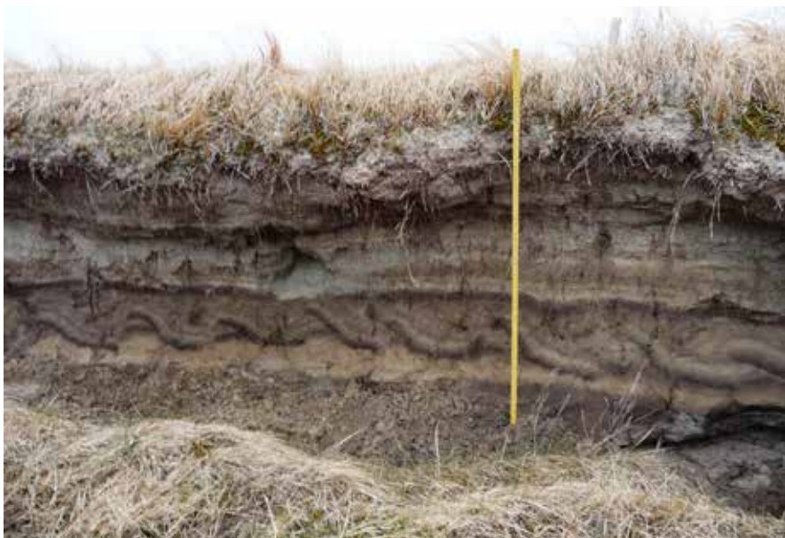
Fig. 6. Vendte furer under tykke sandflugtslag, som er blevet blottet efter jordskred i den stejle erosionskrænt ved Ulbjerg Klint. Furestrimlerne viser en tydelig lagdeling, hvor den mørke muldrige vækstsider er blevet vendt nedad, og den lysere muldfattige bund er blevet vendt opad. Der er kun tale om spor fra én enkelt pløjning, og det kunne derfor ligne et mislykket forsøg på at tage den sandflugtsplagede jord under dyrkning. Også her kan iagttages den karakteristiske bølgeformede furebund.

Flere steder ved St. Sct. Peder Stræde i Viborg blev der i 1972-74 fundet brudstykker af parallelle vendte furestrimler i toppen af et indtil 25 cm tykt pløjelag, samt furespor i bunden af samme lag, der sandsynligvis også skyldes brug af muldfjælspløven (fig. 5). Pløvsporene er ældre end midten af 1000-tallet, hvor området udlægges som regulær bydel, men næppe ældre end 700-tallet. De skal formodentlig knyttes til det gårdsanlæg fra vikingetiden, som er konstateret syd for gaden. 70 Det er interessant, at der i en brønd ved gården er fundet rester af en harve med trætænder af egetræ, som er C14-dateret til 810-990 e. Kr. 71 Harvning som efterbehandling af marken hører sammen med pløjning med pløven og ikke arden, og harveresten fra Viborg må derfor opfattes som endnu et vidnesbyrd om brugen af pløven i Viborg i vikingetiden.