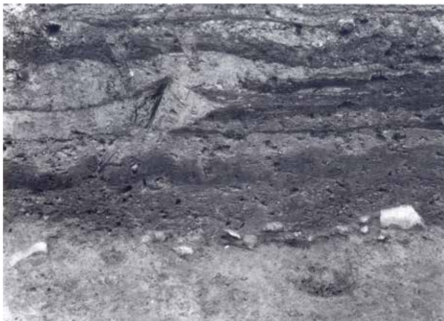
Fig. 5. Tværnsnit gennem vendte furer i toppen af pløjemarken fundet ved St. Sct. Peder Stræde 13 i Viborg. De mørke furestrimler måler ca. 10x30 cm og overlapper delvist hinanden. Pløjemarken overlejres af middelalderlige kulturlag.

Cross-section through turned furrows in the field found at St. Sct. Peder Stræde 13 in Viborg. The dark furrow strips measure 10x30 cm and are partially overlapping. The field is overlain by Medieval culture layers.