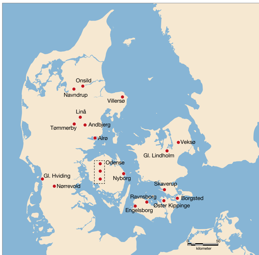
Fig. 2. Fundne plovdele omtalt i artiklen.

Genstandsmaterialet fra det danske område rummer de hidtil eneste kendte jordfund af trædele til muldfjælsploven i form af plovås, sule og løb samt muldfjæl, ligesom det rummer flere fund af langjern, bomtister og skær (fig. 1 og 2).