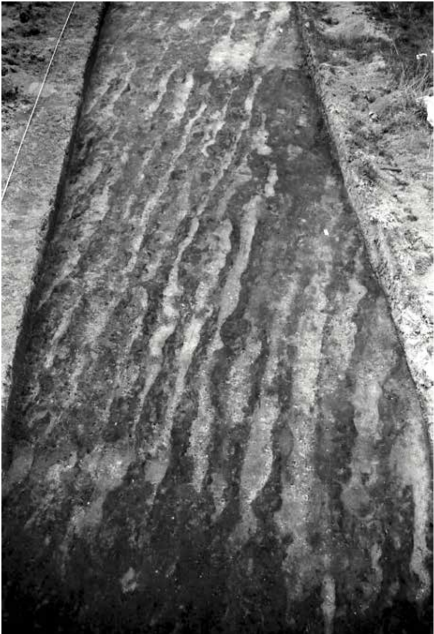
Fig. 4. Markoverfladen ved Klinkerne med parallelle, vendte furestrimler. De lyse striber er undergrundssand, som sammen med det mørke muldlag er blevet afskåret og vendt rundt.

The surface of the field at Klinkerne showing parallel, turned furrow strips. The light stripes are subsoil, which has been cut and turned together with the dark topsoil.