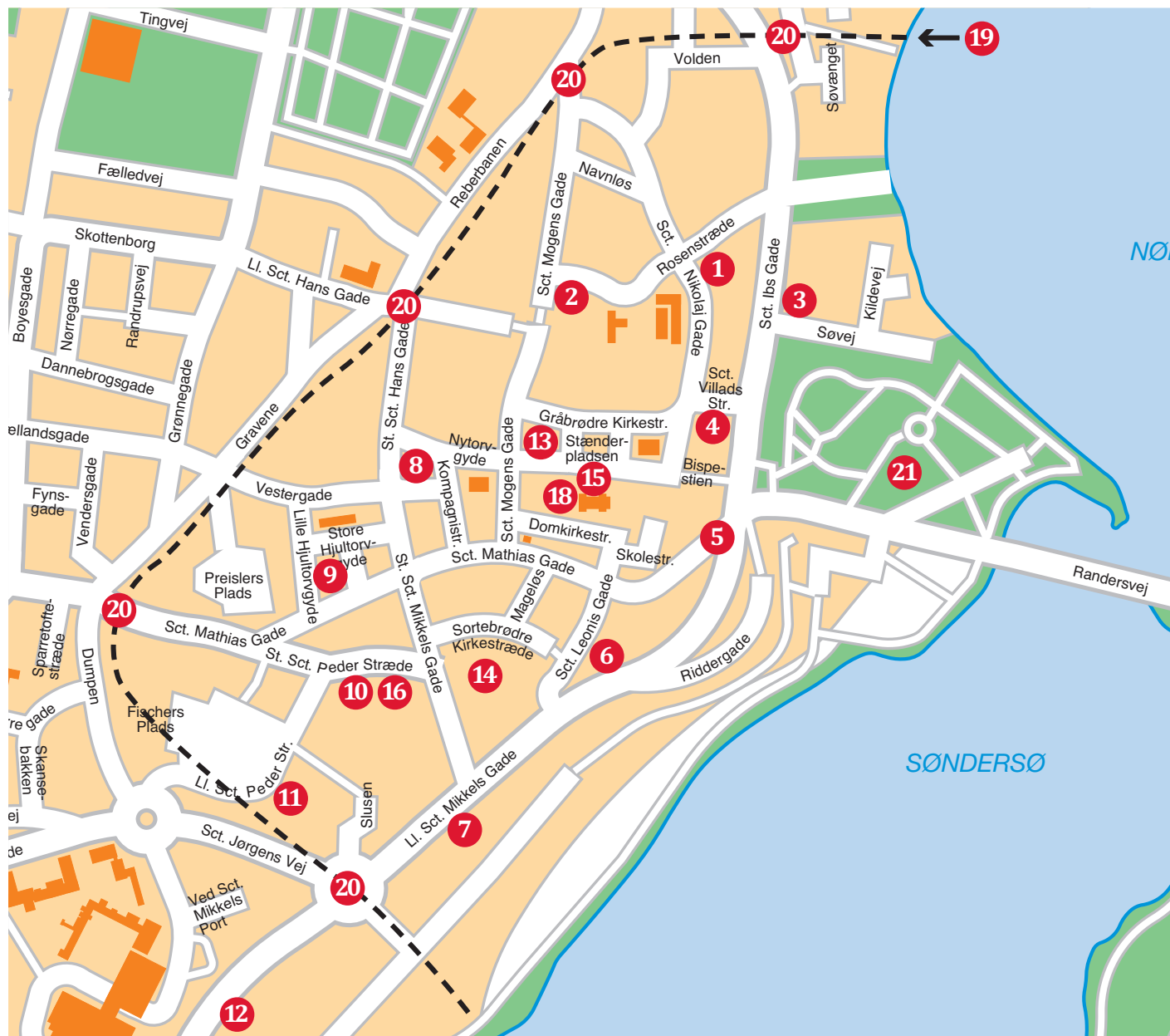
Viborg med angivelse af de i teksten nævnte bygninger og anlæg. (Kort: Viborg kommune).