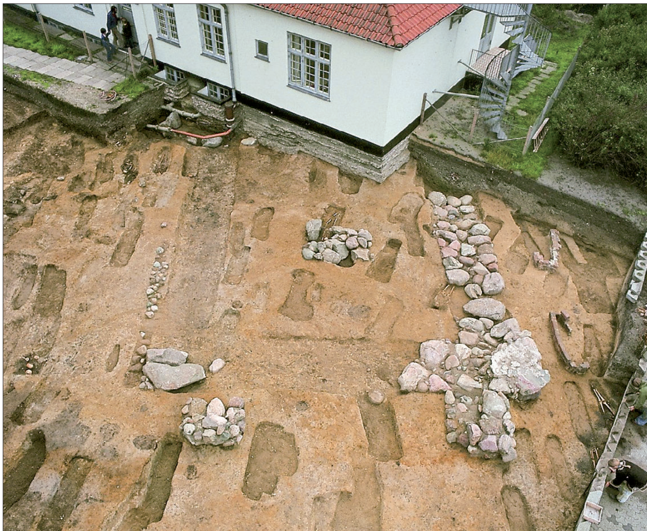
Sct. Mikkels kirke og kirkegård under udgravning. (Foto: Jens Velle).

Sankt Mikael eller Mikkel på dansk er ærkeenglen, der fører sjælene fra dødsriget til dommen på den yderste dag, hvor han vejer sjælens gode og onde gerninger.