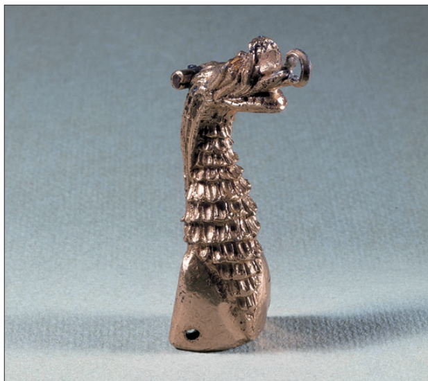
Dragehovedet blev fundet under nedbrydningen af Domkirken i 1864 og menes at have prydet Sct. Kjelds skrin.

Det var ved at blive sent og Gunner og skriveren bevæ-