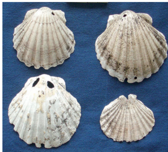
De fire muslingeskaller fra en grav på Sct. Stefans kirkegård viser, at den gravlagte har været på pilgrimsfærd til Santiago de Compostella i Nordspanien, hvor Sct. Jacob ligger begravet.

7 Sankt Stefans kirke og kirkegård var den kirke, der blev fundet rester af, da Ll. Sct. Mikkel's Gade blev udvidet i 1960. I en af gravene må være begravet en pilgrim, for her blev der fundet fire såkaldte Ibs-skaller (se billede). Den hellige Stefan blev stenet ihjel ca. 35 e.Kr. og er den første kristne martyrer.