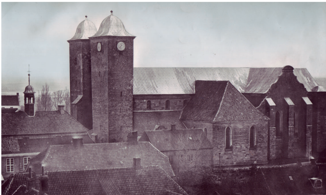
Viborg Domkirke fotograferet umiddelbart før nedbrydningen i 1863 (Foto: Rye).

Den store oprindelige katedral, der stod frem til 1860-erne, er nok påbegyndt ca. 1130, men først engang i 1200-årene var kirken færdigbygget. Store partier har stået med røde munkesten, som for alvor vandt indpas som byggemateriale i slutningen af 1100-tallet. Af den kirke er kun krypten tilbage. Trapper på begge sider fører ned til krypten, hvis hvælvinger hviler på seks søjler – de to midterste af poleret porfyr, de andre af granit.