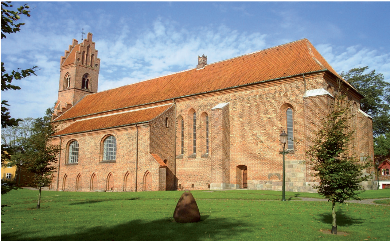
Sortebrødrenes kirkes sydside med resterne af korsgangen - nu indrettet til sideskib. (Foto: Jesper Hjermind).