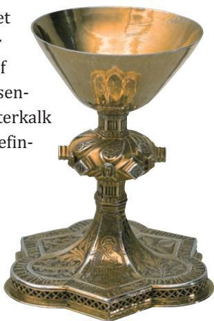
Alterkalken fra Sct. Ibs kirke.

nus, som betyder stor. Flere helgener har senere båret dette navn, og det er mest sandsynligt, at kirken i Viborg er opkaldt efter den hellige Magnus fra Italien. Der stammer også en Magnus fra Orkneyøerne. Han blev dræbt i 1116 på en lille ø Egilsay og ligger begravet i domkirken i Kirkwall.