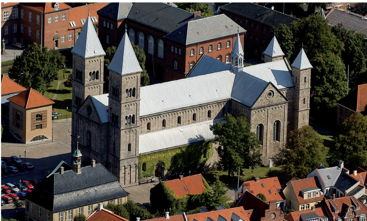
Viborg Domkirke fotograferet i 2004.

En kongelig grav kan kirken også byde på. Efter drabet på Erik Klipping i 1286 førtes liget af ham til Domkirken. En mørk gravsten i koret markerer graven.