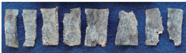
Blystykke med en sygdomsafværgende besværgelse er fundet i en grav på Sct. Mathias kirkegård. (Foto: Liselotte Sørensen).

er blevet udgravet. En enkelt grav skilte sig ud, idet den døde havde fået et blystykke med runeindskrift med i graven (se billede). Indskriften tydes som en trylleformular og en bøn til Jomfru Maria.