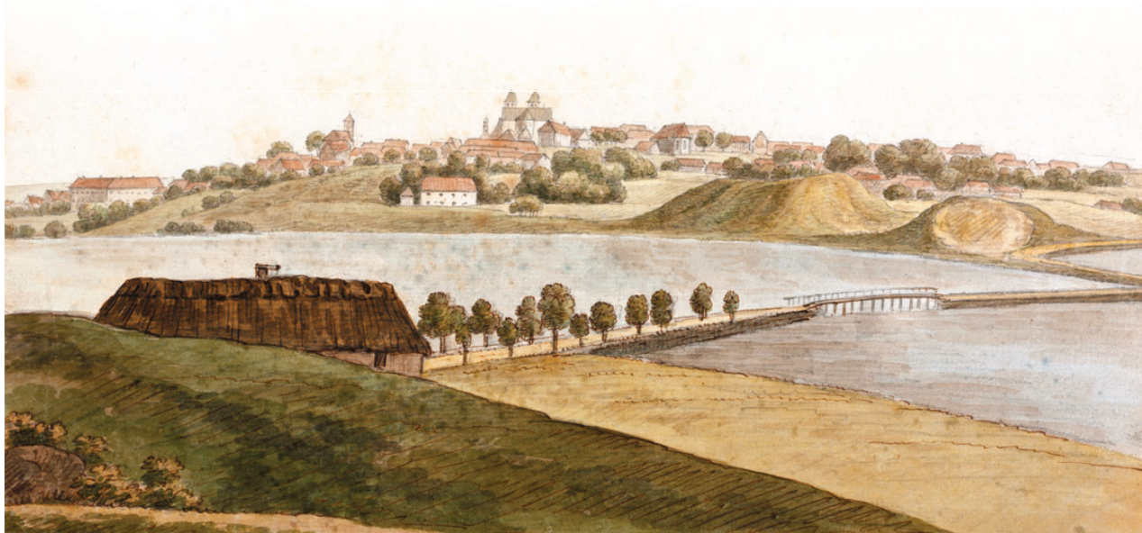
Viborg set fra Asmild 28. juni 1821 af O.J. Rawert. De to banker til højre i billedet er Borgvold og den nu forsvundne Lille Borgvold.

Ingen af de fem byporte (20) er bevaret til i dag. Vi ved, at der i slutningen af 1600-tallet var fem byporte, nemlig fra nord: Sankt Ibs, Sankt Mogens, Sankt Hans, Sankt Mathias og Sankt Mikkels porte og som givet alle rækker tilbage til middelalderen. Sankt Mogens port nævnes i 1530 og var muret af teglsten og havde en hvælving over portrummet. De fire øvrige har været bygget af træ og nok nærmest været af form som en stor låge.