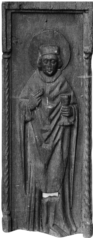
Hellig Kjeld på stolegavl fra Hvidbjerg Kirke.

I 1170-erne hører vi første gang med sikkerhed om augustiner-korherreerne ved Viborg Domkirke, men på dette tidspunkt havde de nok været 50 år i byen. De boede i Mariaklosteret i nærheden af Domkirken, hvor de levede sammen og spiste i fællesskab ganske som i et kloster. Mariaklosteret lå måske nord for Domkirken, som en fløj til den bygning, der i perioden 1834-1848 tjente som stænderhus. I 1440 ophævedes fællesskabet og kannikkerne mødtes i konventshuset, en stor sal med en midterpille, der lå på Domkirkens sydside. Augustiner-kanniken Kjeld eller Ketil, som han kaldtes i samtiden, er Viborgs skytshelgen. Han blev født på Randers-egnen og kom til Viborg, hvor han virkede som kannik ved Domkirken. Han var kendt for sit fromme liv og for at udføre flere mirakler. Straks efter sin død i 1150 begyndte folk at valfarte til hans grav. Her fik blinde synet igen, stumme begyndte at tale og mange blev befriet for onde ånder. Ved Absalons mellemkomst blev han officielt helgenkåret af Paven og skrinlagt i 1189. Når han gives på billeder ses han som augustiner-kannik med en alterkalk i hånden.