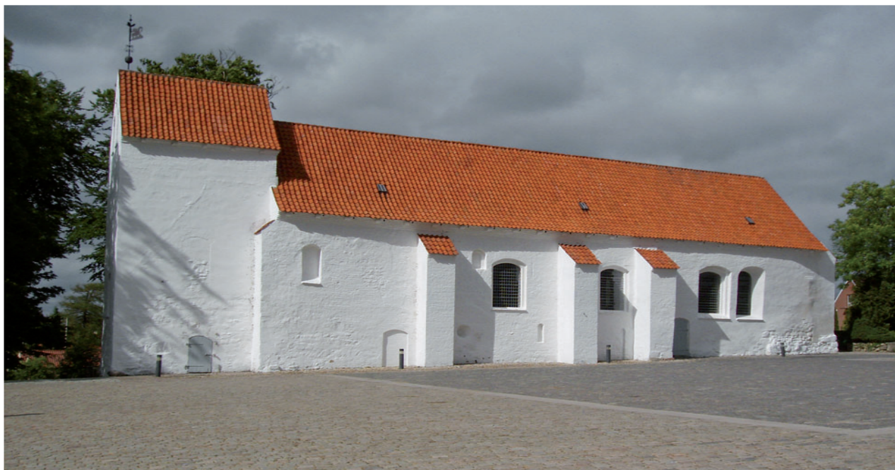
Asmild kirke rummer resterne af den tidlig frådstenskirke fra o.1100, der blev indrettet til klosterkirke for augustiner-nonnerne i årene omkring 1167.

Der er også fundet andre former for tidsfordriv: en terning og en lille fløjte. Ikke ting man forventer i et kloster. Men lidt uregelmæssighed fra kloster-tugten har priorinden set gennem fingre med.