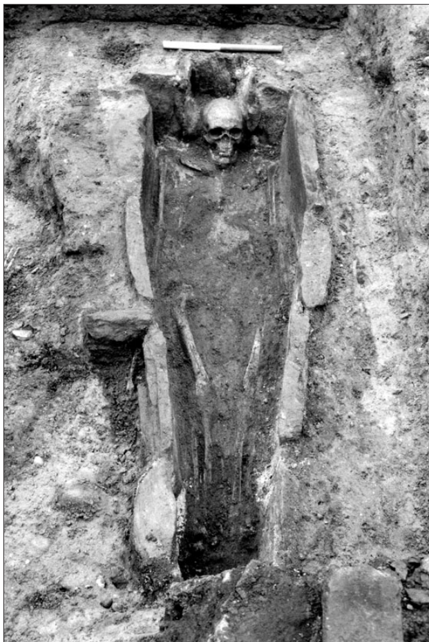
En stensat grav fra Sct. Mathias kirkegård. Den er nu udstillet på Viborg Stiftsmuseum.