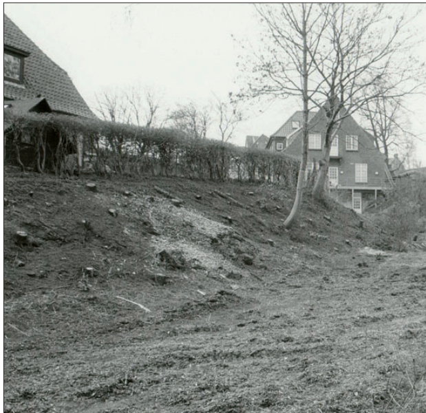
Volden i den nordlige del af byen har udnyttet en naturlig skrænt (20).

Ja, enkelte gæster havde stadig markedsstemningen i kroppen.